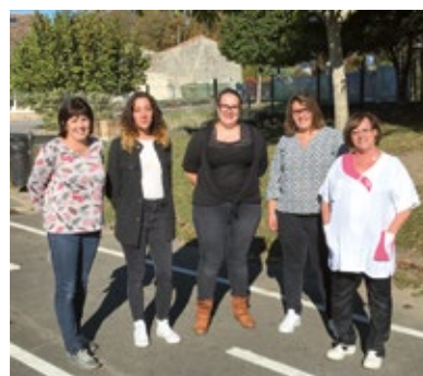
Équipe de la garderie du soir côté élémentaire