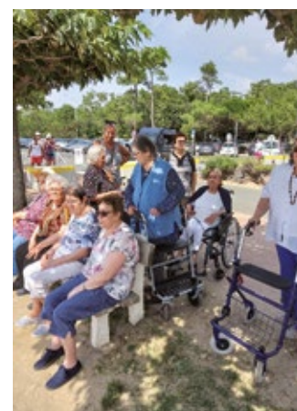
Sortie à Marennes