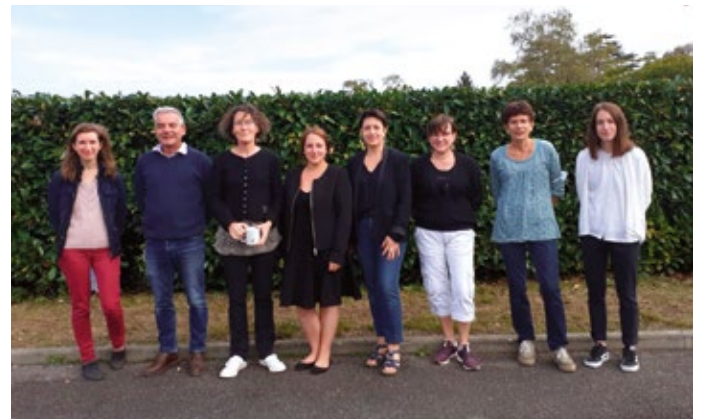
Le directeur et les maîtresses des CE2 - CM1 - CM2