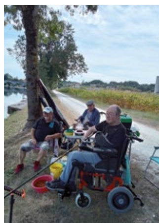
Balade île de Foulpougné au Gond-Pontouvre