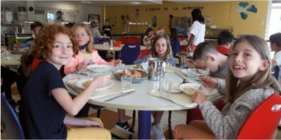
Les enfants apprécient la nouvelle cantine.