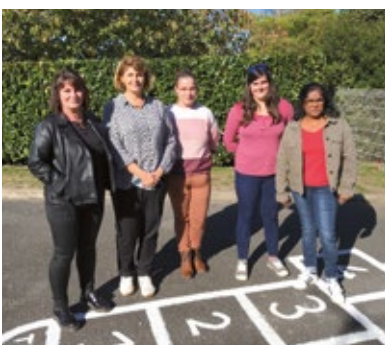
Équipe de la garderie du soir côté maternelle