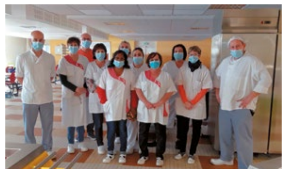
Équipe de restauration