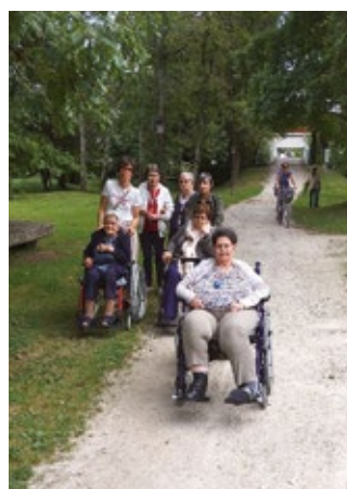
Partie de pêche