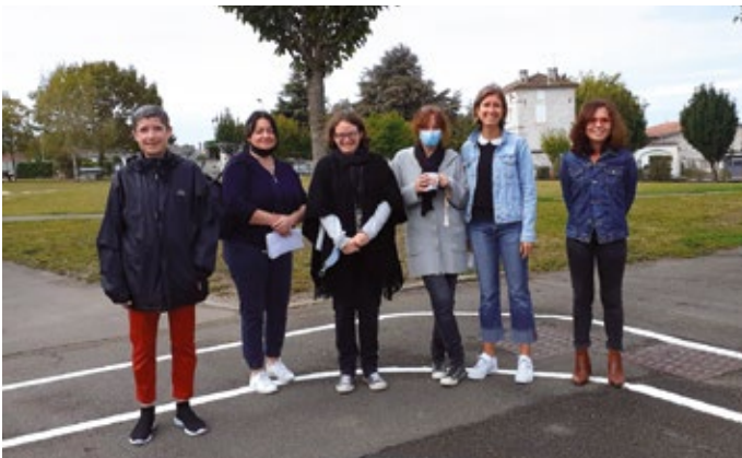
Les maîtresses du CP - CE1 - CE2