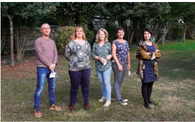
L'équipe des enseignants de la maternelle